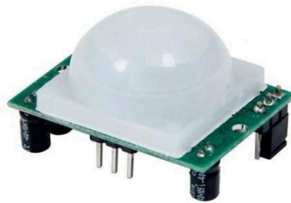
Внешний вид устройства Размер печатной платы 32x24мм